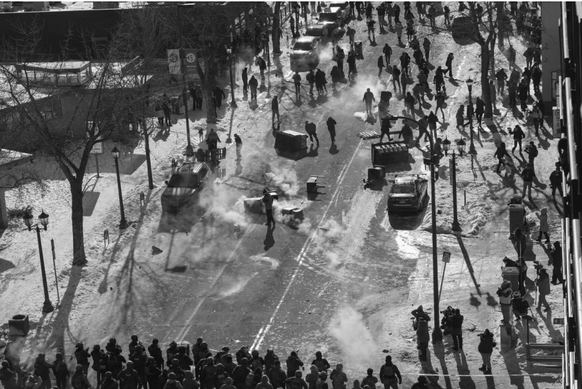
24 de enero de 2026. La gente responde al asesinato de Alex Pretti.

La magnitud de la resistencia llevó a Stephen Miller a comentar: «Solo hay que leer sus propias palabras, escuchar sus propias palabras y juzgar su propia conducta para comprender que se trata claramente de una insurgencia contra el Gobierno federal».