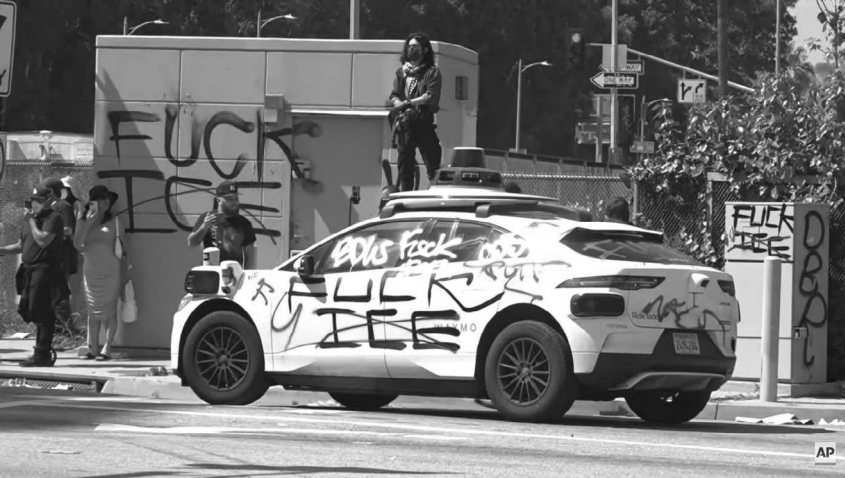
Manifestantes en Los Ángeles, junio de 2025.

Las protestas del No Kings estaban programadas para el 14 de junio, el día en que Trump organizó un desfile militar en Washington DC por su cumpleaños. Con la Guardia Nacional en las calles, algunos temían que el día anunciara el inicio del régimen militar.