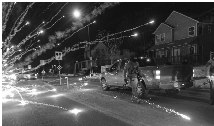
14 de enero de 2026. La policía y los agentes federales aterrizan al barrio tras disparar a Julio Sosa-Celis.

El ICE se retiró primero, abandonando al menos tres vehículos. La policía municipal huyó poco después. Los jóvenes de Northside pintaron y destrozaron sus coches, robaron una caja fuerte para armas de un maletero y convirtieron la escena en una animada fiesta callejera. Los testigos retransmitieron en directo cómo la gente rebuscaba en los vehículos del ICE, sacando documentos confidenciales y «monedas de desafío» distribuidas a los mercenarios por perpetrar daños contra las comunidades. Los agentes federales no regresaron hasta horas más tarde.