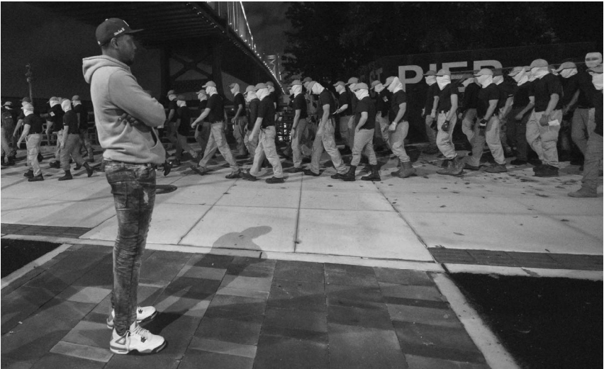
Fascistas del grupo Frente Patriota marchando en 2021. El auge del fascismo es la consecuencia lógica del neoliberalismo.

De nuevo, esto no fue simplemente iniciativa de unos pocos individuos malévolos, sino consecuencia de desarrollos estructurales. En los años 50, Estados Unidos y la Unión Soviética pudieron subvencionar redes de seguridad social para sus ciudadanos, en parte gracias a la extracción directa de recursos en las partes del mundo que sufrían sus emprendimientos imperialistas. Tras el colapso del bloque soviético, el mundo se dividió en las naciones consumistas y adineradas del núcleo imperial, donde la mayoría de los ciudadanos disfrutaba de los privilegios de la democracia, y las naciones productoras empobrecidas de la periferia, donde la mayoría de la población era tratada como mano de obra barata y sometida a regímenes represivos correspondientes. A medida que las disparidades económicas se amplían y la vida se vuelve más precaria en el núcleo imperial, no debería sorprender que las libertades políticas también se estén erosionando aquí, mientras que las formas de represión que se practicaban en el extranjero se trasladan a casa. Aimé Césaire denominó a esta última tendencia el boomerang imperial .