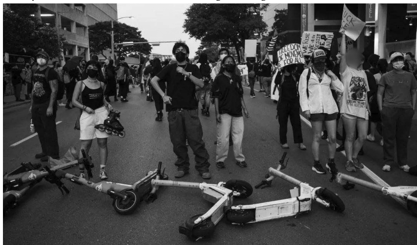
Los y las manifestantes se colocan detrás de una línea de patinetes eléctricos arrastrados a la calle para defenderse de las incursiones policiales.

Sin saberlo, las animadoras del capitolio siguieron bailando, especialmente cuando se encendió el semáforo para peatones, lo que inspiró a parte de la multitud a cruzar la calle. La multitud se re-movilizó en oleadas. La primera oleada tomó una ruta por la acera de vuelta al Pickle, donde chocó con el grupo más pequeño que acababa de ser gaseado. Juntos, crearon una barrera de patinetes al otro lado de la calle detrás de ellas y comenzaron a enfrentarse a la policía que tenían delante.