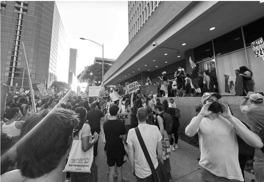
La marcha rodea el edificio federal JJ Pickle en el centro de Austin, que ICE utiliza como base de operaciones y centro de detención temporal.

La manifestación del PSL comenzó a marchar, seguida por una escolta policial en motocicleta, y llegó a las instalaciones del ICE a las 19:45. El grupo estaba enérgico y enfadado. Una gran multitud coreaba consignas frente al edificio. Los tambores marcaban el ritmo al son de las ventanas rotas. Algunas personas arrastraron patinetes a la calle; otras pintaron consignas a favor de la inmigración y en contra del ICE o lanzaron globos llenos de pintura. Mientras tanto, los organizadores del PSL, vestidos con camisetas rojas, instaban a la multitud a seguir avanzando. Decenas de personas se resistían, coreando «¡El ICE está aquí!». No obstante, a las 8 de la tarde, los organizadores del PSL habían movilizado a la mayor parte de la multitud para que regresara al Capitolio, convenciendo con éxito a algunas de las personas participantes de que moverse mantendría al grupo a salvo. Un grupo escindido de unas 100 personas se quedó atrás y siguió expresando sus sentimientos con arte y música. La marcha se dividió efectivamente entre las personas que actuaban por iniciativa propia y las que se sometían a la autoridad del PSL.