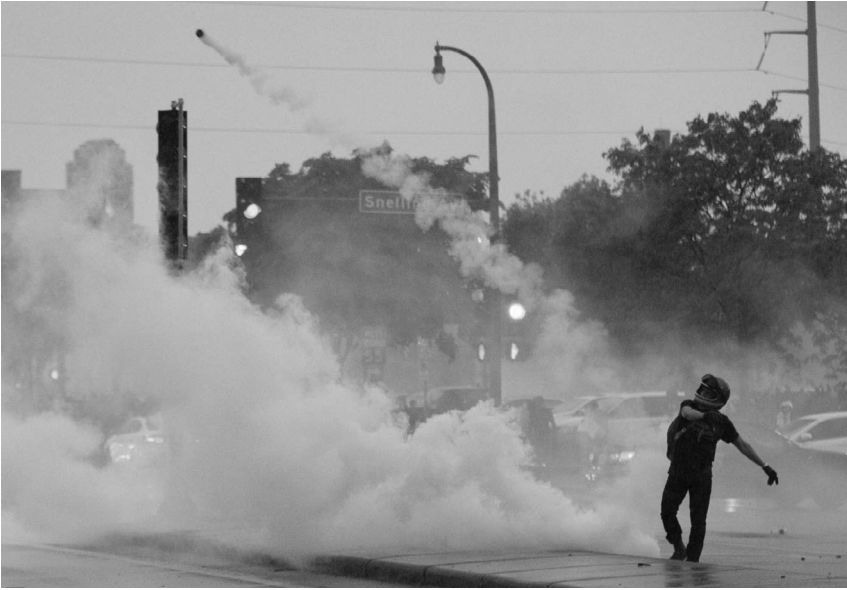
Manifestante devuelve un bote de gas lacrimógeno a los asesinos que lo lanzaron durante las manifestaciones en Minneapolis en mayo de 2020, en respuesta al asesinato de George Floyd.

Debemos asegurarnos de que a todo el mundo le resulte fácil distinguir nuestros proyectos de base de cualquier gobierno que ostente el poder, y seguir ampliándolos y profundizándolos independientemente de si hay un demagogo incompetente impulsando a la gente a salir a la calle. Como hemos aprendido una y otra vez —a veces por valentía, a veces por cobardía— es más seguro estar al frente.