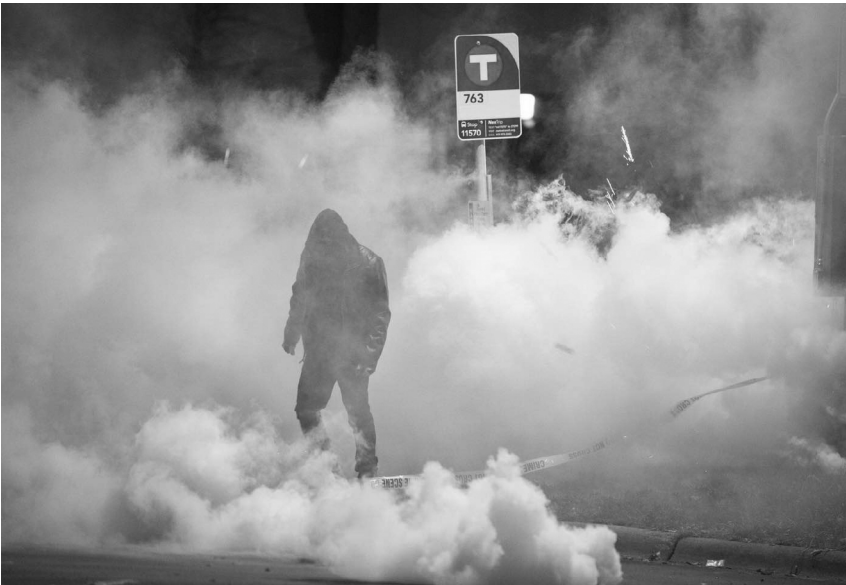
Un manifestante soporta los agentes químicos en Minneapolis para defender lo mejor de la humanidad.

El principal imperativo que impulsa las decisiones de la Administración Trump es la necesidad de proyectar fuerza. Lo han apostado todo a la construcción del poder duro en lugar del poder blando, a la intimidación en lugar de la persuasión. Ahora que han agotado la mayor parte de su capital político, el terreno se abre para otros.