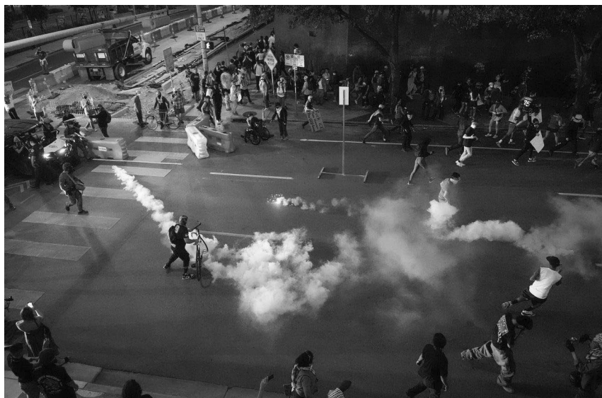
La policía estatal lanza gases lacrimógenos para intentar dispersar la protesta, y algunas personas de entre la multitud devuelven los botes.

Por último, puede ser útil tener refuerzos materiales listos para su entrega una vez que la marcha comience.