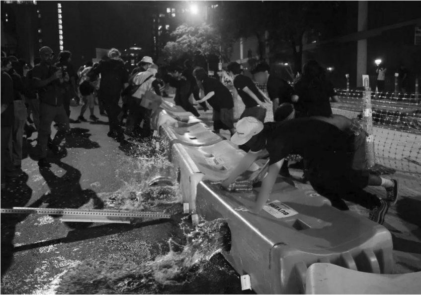
Manifestantes volcando las barricadas de la obra, vaciándolas y llenando la calle de agua.

barricadas de la construcción, inundando la calle. A todo el mundo le encantó. Alboroto, fiesta, alegría.