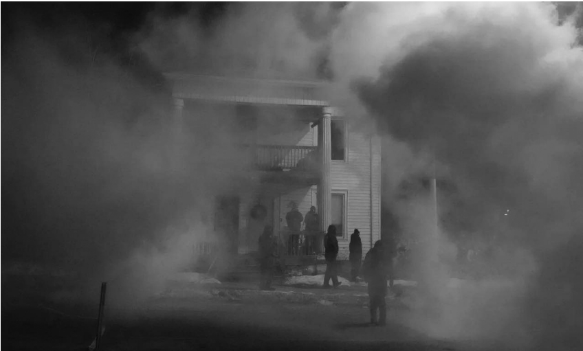
14 de enero de 2026. La policía y los agentes federales lanzaron gases lacrimógenos a todo un barrio después de disparar a Julio Sosa-Celis