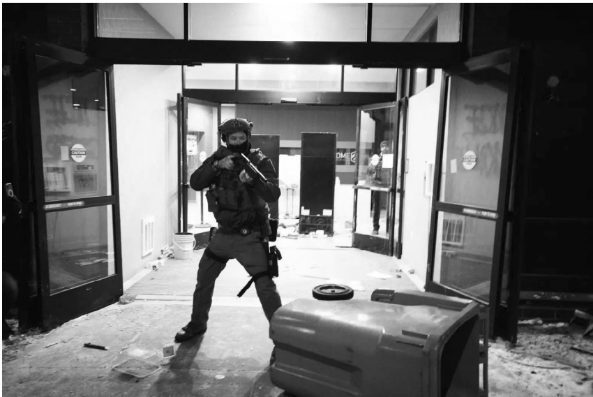
25 de enero de 2026: un mercenario federal amenaza a personas fuera de un hotel donde se alojan agentes del ICE.

En lugar de una reducción, lo que estamos viendo es simplemente un cambio de estrategia. El gobierno estatal ha dado acceso al ICE a todas las cárceles del condado. Puede que el ICE sea menos visible y que esté aterrorizando a los suburbios con más intensidad que a los centros urbanos, pero sigue aquí: su parque móvil sigue lleno en Whipple y sigue secuestrando gente todos los días. La «reducción» es más una operación mediática para apaciguar a la audiencia que una realidad sobre el terreno en las Ciudades Gemelas. Organizaciones locales están convocando una semana de acción del 25 de febrero al 1 de marzo para mantener la presión en un momento en que el régimen está tratando de liberarla.