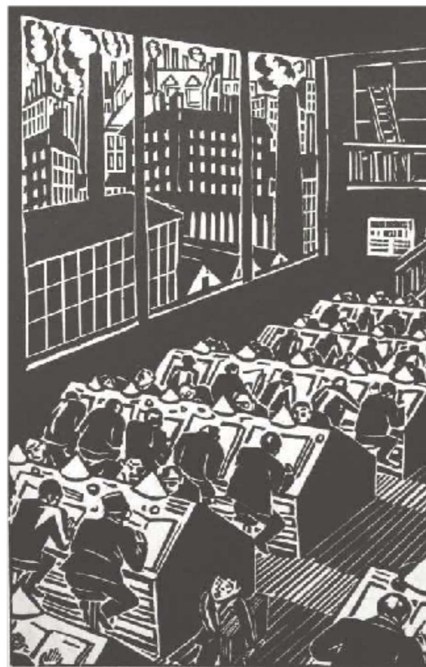
- "Não existe modelo único de sociedade livre."

O único outro modelo para o governo "revolucionário" é o Capitalismo de Estado sem fachada representado pela China, no qual as elites acumulam riquezas à custa dos trabalhadores, tão descaradamente quanto nos Estados Unidos.