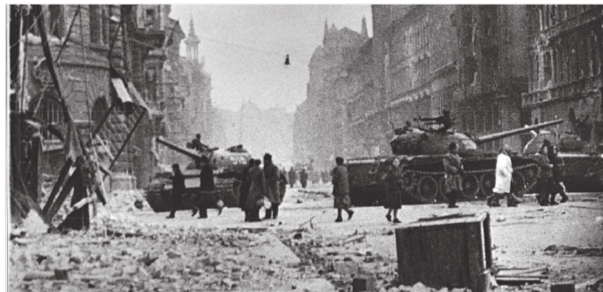
- Tanques russos rondando pelas ruas de Budapeste para reprimir a revolta de 1956.

Quando grupos revolucionários tentam desfazer as desigualdades de classe criadas pela propriedade privada do capital, dando controle total do capital ao Estado, isso simplesmente torna a classe que detém o poder político na nova classe capitalista. A palavra para isso é Capitalismo de Estado. Onde quer que você veja representação política e gestão burocrática, você encontrará a sociedade de classes. A única solução real para a desigualdade econômica e política é abolir os mecanismos que criam diferenciais de poder em primeiro lugar – não usando estruturas estatais, mas organizando redes horizontais de autodeterminação e defesa coletiva que tornam impossível a aplicação dos privilégios de qualquer elite econômica ou política. Este é o oposto de tomar o poder.